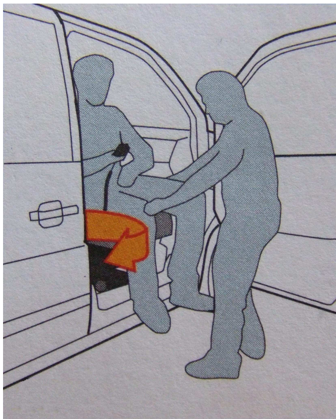
Faire tourner le siège prudemment.