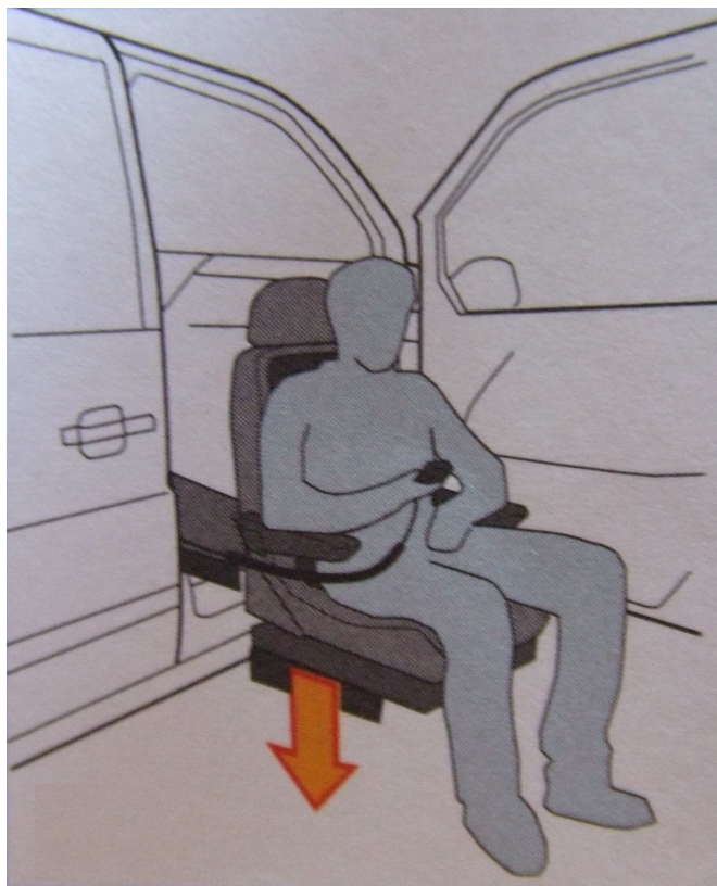
Utiliser la télécommande pour piloter la descente du siège.