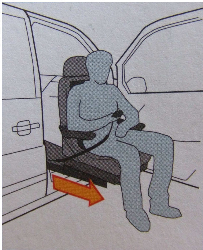
Utiliser la télécommande pour piloter la sortie du siège hors de la voiture.