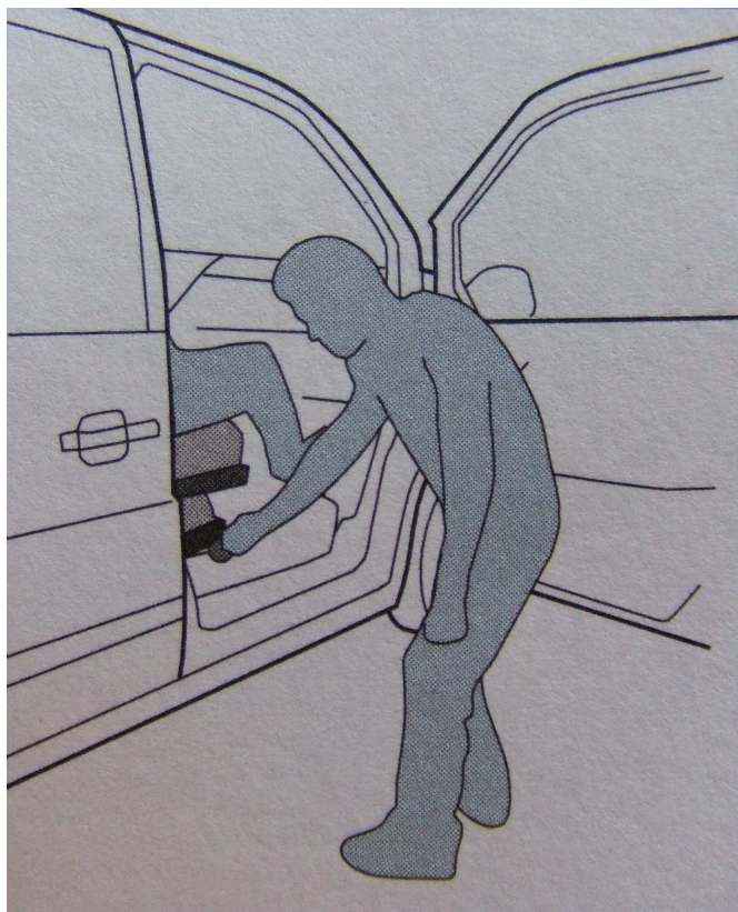
Lever la manette située sur le côté du siège.